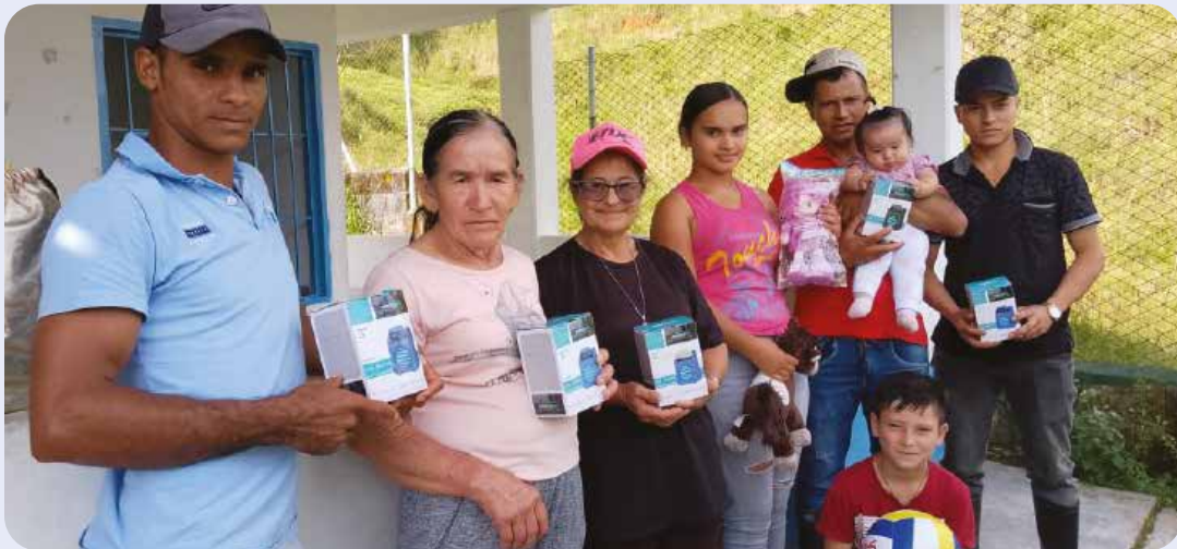
Comunidad de la vereda San Luis de Santo Domingo

¡No hay mejor recompensa que una sonrisa!