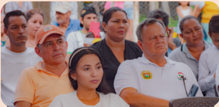
La propuesta integra a la comunidad local, emprendedores y diversas instituciones en un esfuerzo conjunto para dinamizar el desarrollo regional a través de la promoción de la cultura, la gastronomía y la organización comunitaria.