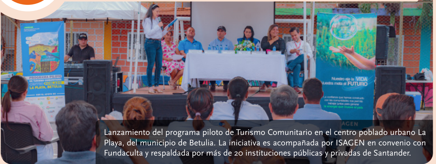
Lanzamiento del programa piloto de Turismo Comunitario en el centro poblado urbano La Playa, del municipio de Betulia. La iniciativa es acompañada por ISAGEN en convenio con Fundaculta y respaldada por más de 20 instituciones públicas y privadas de Santander.