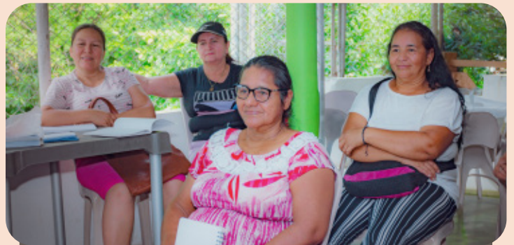
El proceso incluye un programa de formación de 120 horas presenciales en las que los emprendedores se capacitan en: turismo comunitario, primeros auxilios, atención al cliente, diseño de rutas turísticas entre otros.