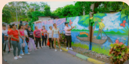
Aprender de la cultura de pescadores – en la imagen se aprecia el muralismo como expresión popular.