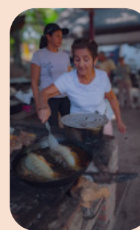
Disfrutar de los Platos típicos ribereños: como el bocachico frito o frito sudado, la viuda de pescado y el sancocho, entre los más solicitados.

El baño en el río y la pesca artesanal son otras actividades que pueden disfrutar de manera responsable quienes visiten La Playa.