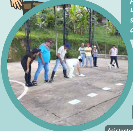
Asistentes de la vereda Mangos.

“El reconocimiento y credibilidad que el programa ha tenido en las organizaciones, la unión y el fortalecimiento de las JAC, además se afianzan los liderazgos y se potencializan con el programa”.