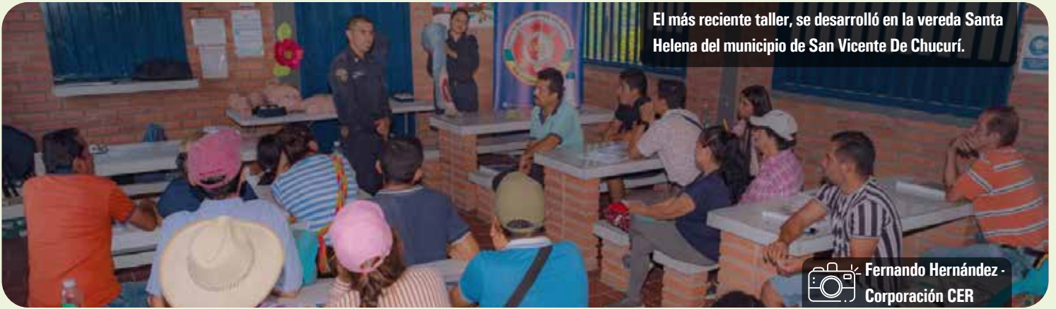
El más reciente taller, se desarrolló en la vereda Santa Helena del municipio de San Vicente De Chucurí.